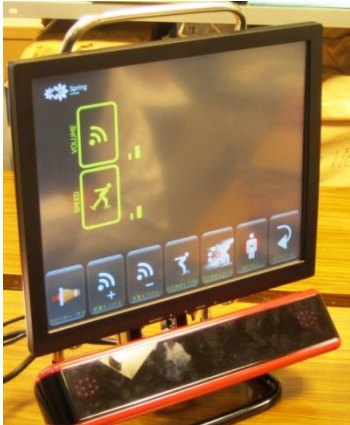
視線入力意思伝達装置